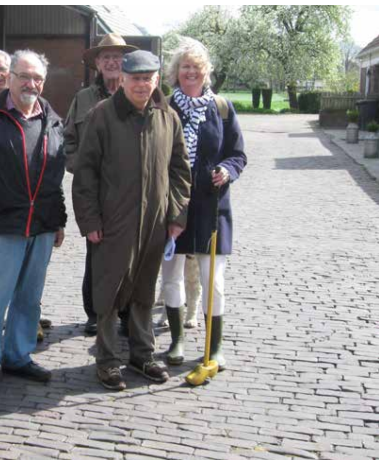
PESACH IN LUNTEREN, 2017

De afdeling Joodse activiteiten van JMW organiseert regionale bijeenkomsten door heel Nederland. JMW organiseert koffie-ochtenden, maaltijden tijdens de Joodse feestdagen, uitstapjes, culturele evenementen, concerten, themabijeenkomsten, filmvertoningen en een telefooncirkel voor Joodse alleenwonenden. Voor Israëli's in Nederland vindt er één keer per jaar een Israëlische avond plaats (Jom Tsavta) met workshops, Israëlische livemuziek, eten en boekenverkoop. In Lunteren wordt ieder jaar een geheel verzorgde Pesach-week georganiseerd voor Joodse ouderen.