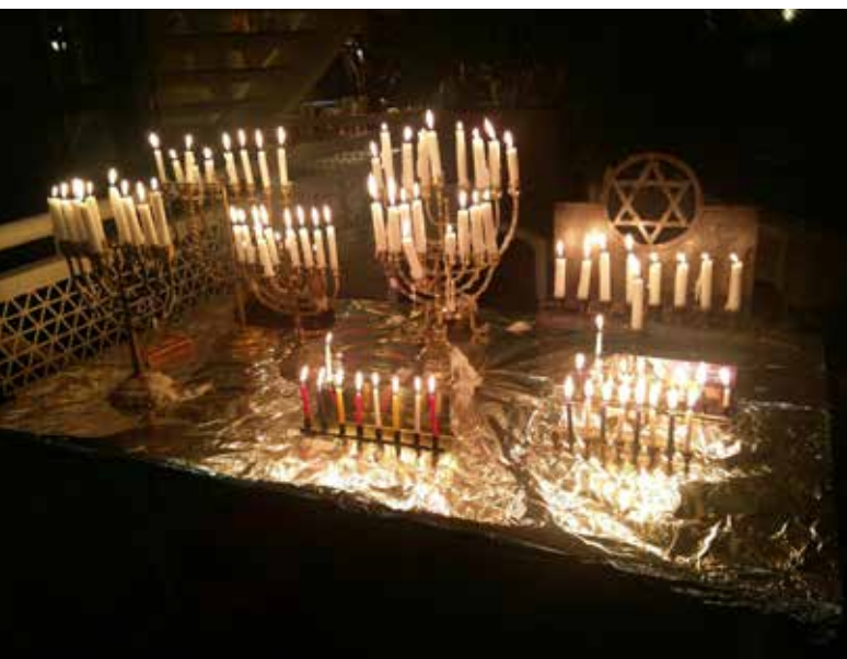
CHANOEKA BIJ MITZWE BAR IN HET MR. L. E. VISSERHUIS IN DEN HAAG, 2017

JMW organiseert gespreksgroepen waar, door middel van het bieden van veiligheid en onderlinge steun, cliënten de gelegenheid