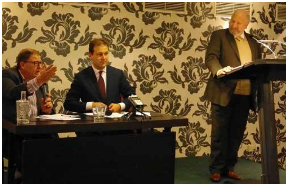
Bijeenkomst over antisemitisme met minister Asscher

De ontwikkelingen in de (Joodse) zorg waren al langer voor JMW aanleiding om ook naar zijn toekomst te kijken. JMW wil de toekomst in eigen handen houden en heeft daarom in de afgelopen twee jaar intensief gesproken over het strategisch beleid. Bij deze exercitie werden alle geledingen binnen JMW betrokken. Een belangrijke vraag in de besprekingen was of JMW zelfstandig moest verder gaan en welke delen van de organisatie in ieder geval behouden moesten blijven. De uitkomst was dat slechts weinigen zich een Joodse gemeenschap zonder JMW konden voorstellen.