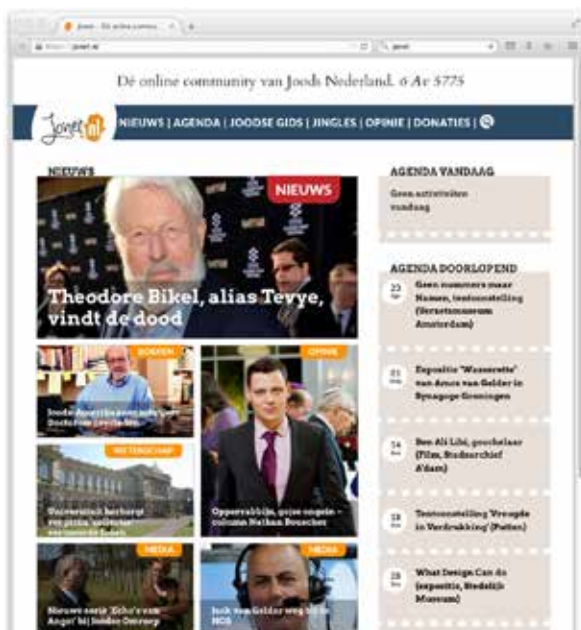
De nieuwe Jonet website

Op het gebied van fondsenwerving zijn meerdere fondsen benaderd met het verzoek om bij te dragen aan de financiering van Jonet. De stichting Levi Lassen heeft inmiddels voor de jaren 2015, 2016 en 2017 een bedrag van € 25.000 per jaar toegezegd.