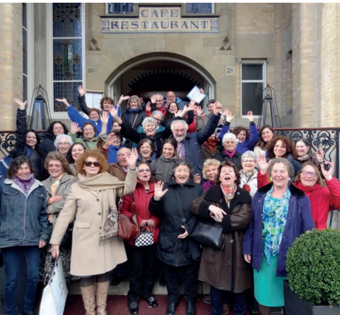
Vrijwilligersdag maart 2014