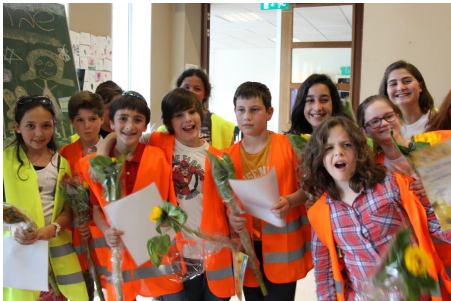
JMW's cursus leerlingmediation