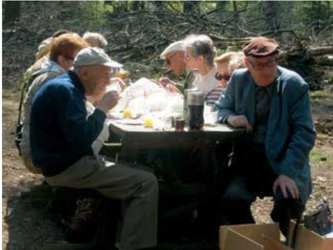
Pesach in Lunteren