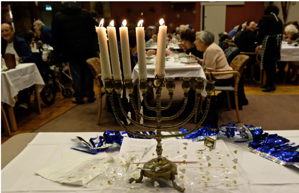
Chanoekamaaltijd van Lev 2016, de vierde dag